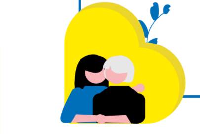
Народився до 1958 року, за естонськими законами досяг пенсійного віку