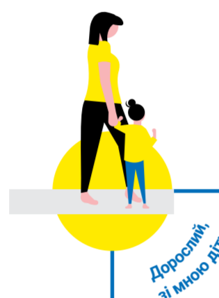
Дорослий зі своєю дитиною

Візьміть із собою посвідчення особи, а також решту документи, які у вас є на дитину та її батьків. Візьміть з собою також рішення про надання статусу тимчасового захисту. Крім того, повідомте посольству України в Естонії про те, що діти знаходяться в Естонії.